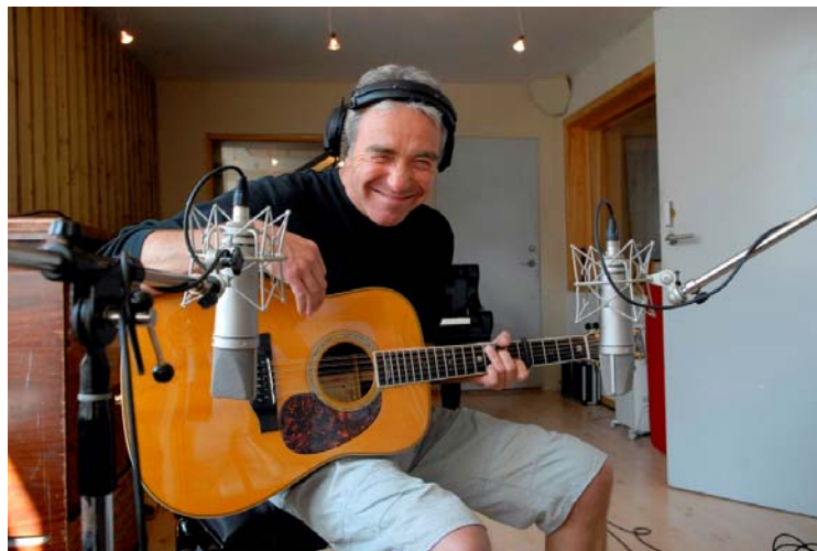
VI SES DERUDE