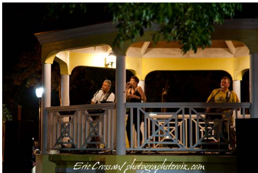
Fra koncerten i Frederikssted