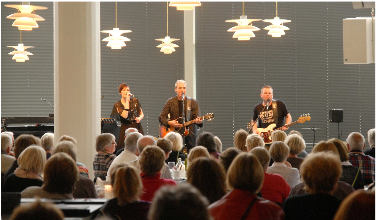
Århus Musikhus 02.10 2010